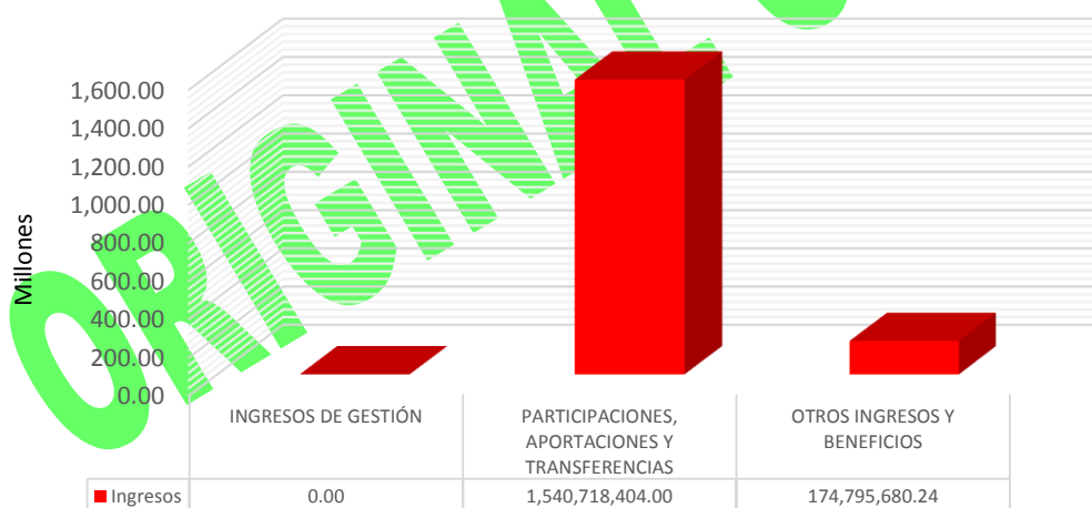
GRÁFICA 1 INGRESOS

Fuente: Estado de Actividades y documentación presentada por los H.H. Tribunales Superior de Justicia, de lo Contencioso Administrativo, de Conciliación y Arbitraje, Electoral y Consejo de la Judicatura.